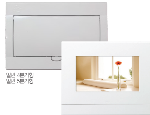
일반 4분기형 일반 5분기형